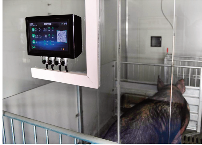
An automatic temperature and humidity controller at a pig farm in Jiaxing, China.

Read the text to answer questions 21 to 23.