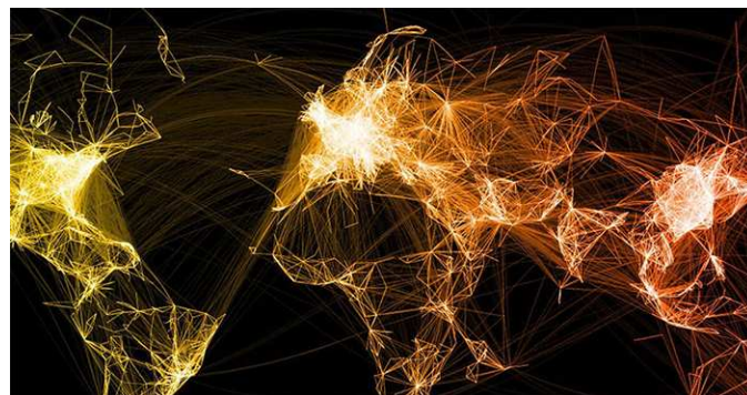
Hiperconectividade das megacidades. https://www.paragkhanna.com/maps-that-show-why-cities-rule-the-world/

23 A combinação de dispersão espacial e da integração global criou um novo papel estratégico para as megacidades .