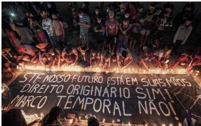
Índios fazem manifestações em Brasília a respeito dos critérios para as demarcações das terras indígenas. (agosto de 2021).

Ao analisar uma demanda do povo indígena Xokleng, de Santa Catarina, o Supremo Tribunal Federal foi chamado para avaliar a validade do conceito do chamado "marco temporal". A decisão tem repercussões para vários outros povos que pleiteiam a demarcação de territórios e, por isso, cerca de 6.000 indígenas de mais de 170 povos acamparam por semanas na Esplanada dos Ministérios. Foi a maior mobilização indígena na capital federal desde a Assembleia Constituinte, entre 1987 e 1988, segundo associações indígenas.